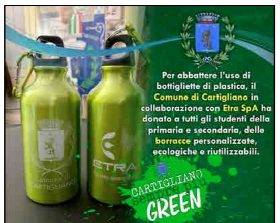
Per abbattere l'uso di bottigliette di plastica, il Comune di Cartigliano in collaborazione con Etra SpA ha donato a tutti gli studenti della primaria e secondaria, delle borracce personalizzate, ecologiche e riutilizzabili.